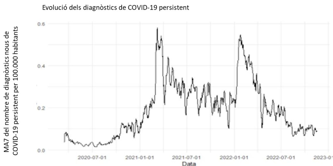
Figura 2. Evolució de la mitjana mòbil de 7 dies (MA7) de la taxa de casos de COVID-19 persistent registrats a l'ECAP per 100.000 habitants

S'observa un gradient segons el nivell socioeconòmic, amb taxes superiors en pacients d'àrees urbanes amb més privació (198,5 per 100.000 habitants) que en els d'àrees rurals o urbanes amb menor privació (168,5). També s'observen diferències importants en la taxa de diagnòstic de COVID-19 persistent entre els diferents equips d'atenció primària, amb alguns que tenen taxes que són més del doble de la mitjana.