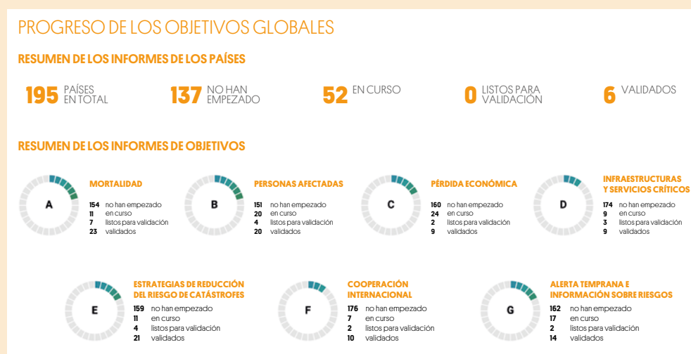
FIGURA 3. Consecución de las metas fijadas por el Marco Sendai.